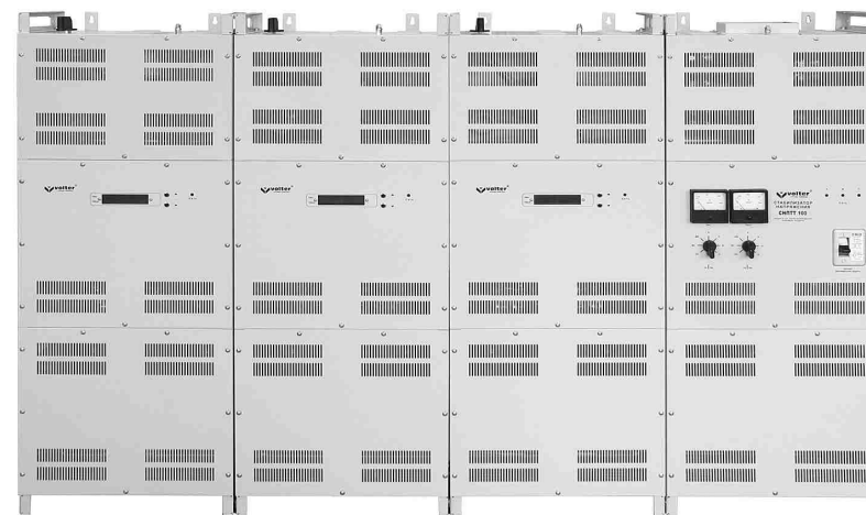
Рис. 1. Стабилизатор напряжения

Блоки стабилизатора состоят из 3-х отсеков. Для крепления к стене каждый блок имеет специальные петли в верхней части. Для крепления к полу используются отверстия в ножках блоков.